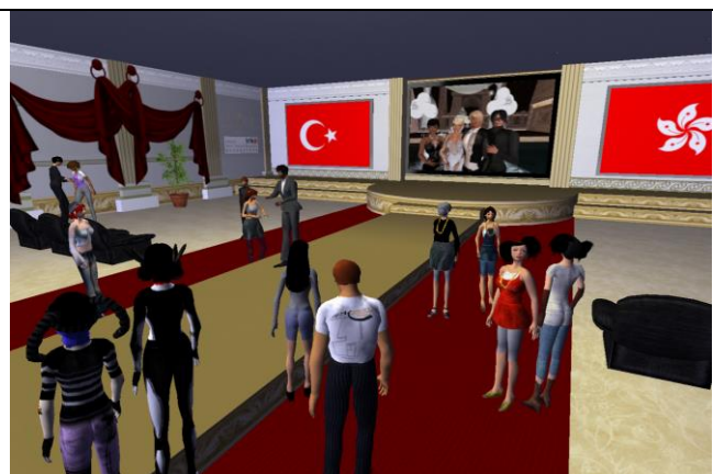
理大酒店及旅遊業管理學院的學生透過 Second Life 到土耳其一家虛擬酒店參觀