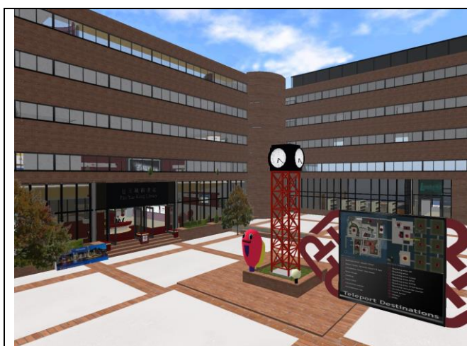
理大是全港第一所在 Second Life 建構虛擬校園的大學

Second Life 是由 Linden 實驗室開發的一個網上平台，虛擬世界裏的內容是由化身為「居民」的用戶創造的。據稱現時全球用戶逾一千六百萬，二零零九年期間，同時登入的用戶人數最高達八萬八千二百人。現時世界各地許多大學都已經在 Second Life 建構自己的虛擬校園。