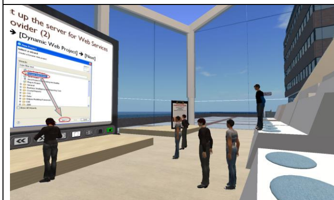
理大電子計算學系為兼讀制學生設計的虛擬課堂