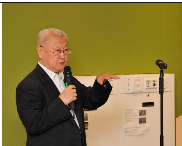
中國社會科學院旅遊研究中心主任 張廣瑞教授