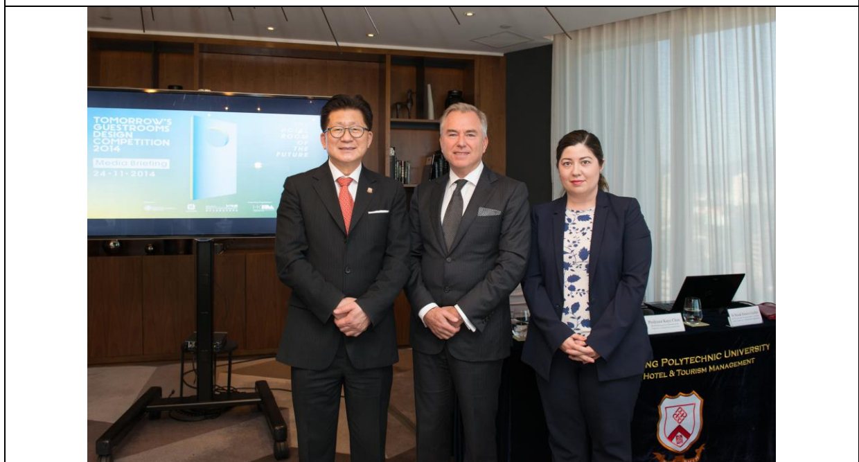
(左起) 田教授、海德先生及丁博士於媒體介紹會後合照。